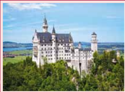
Füssen, Schloss Neuschwanstein